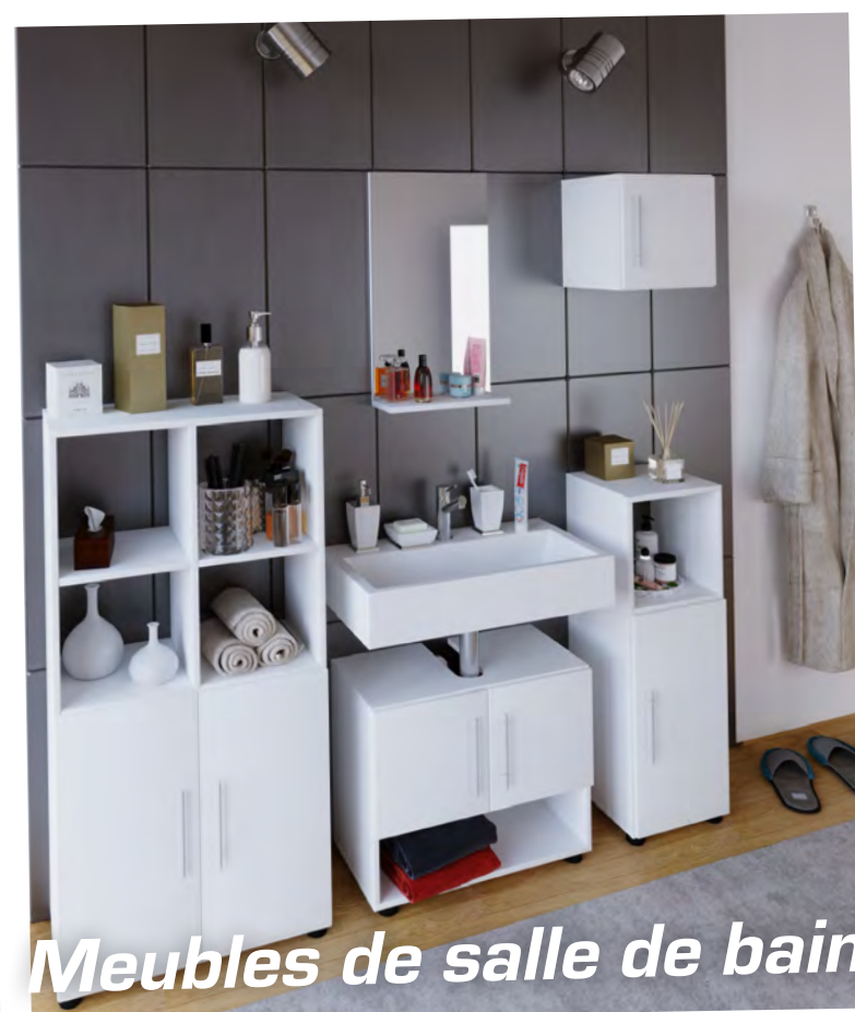
Meubles de salle de bain