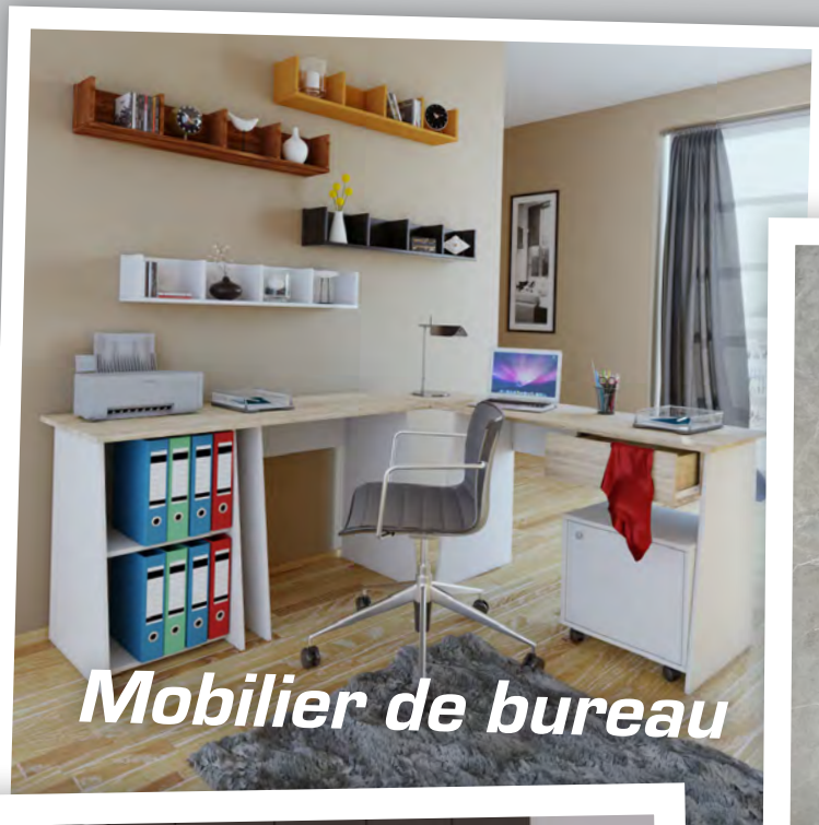
Mobilier de bureau